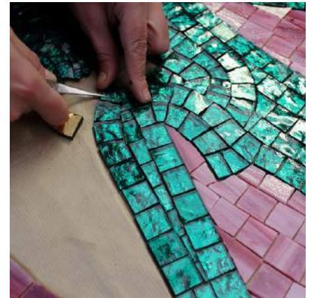
L'esprit du Lac (Mosaïque murale)

À l'occasion de l'inauguration du nouvel Office de Tourisme du Haut-Bugey et de son "Espace 3 Lacs" qui représentent les territoires de Nantua, des Monts Berthiand, de la Combe du Val Brénod et d'Oyonnax, l'artiste plasticien GRATALOUP dévoile un ensemble de toiles autour d'une mosaïque murale de 20 m 2 , L'Esprit du Lac .