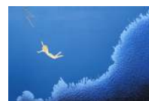
L'esprit de l'Air