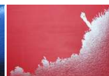
L'esprit du Feu