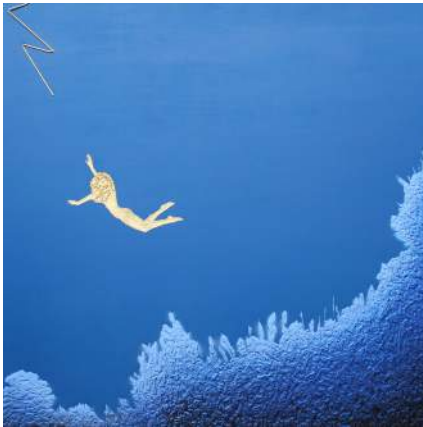
L'esprit de l'Air (Toile 195 x 130 cm)

La nature est bien là mais elle est aussi ailleurs, particulière, invisible, symbolique, cachée... Mais elle est peut être dévoilée. C'est le rôle de l'Art dans sa sémantique du visible, lisible et dans une nouvelle réalité de sa notion infinie, sereine ou dramatiquement amicale.