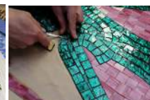
L'esprit du Lac