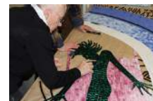
L'esprit du Lac